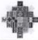
Imagen 2 Estructura funcional Unidad Operativa Departamental