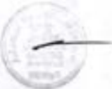
Ing. Remmy R. González Artila MINISTRO DE DESARROLLO RURAL Y TIERRAS

RRGANLLCHAYMpel H.R.I./22665-2021 Cc: Archivo DGAJMDRyT