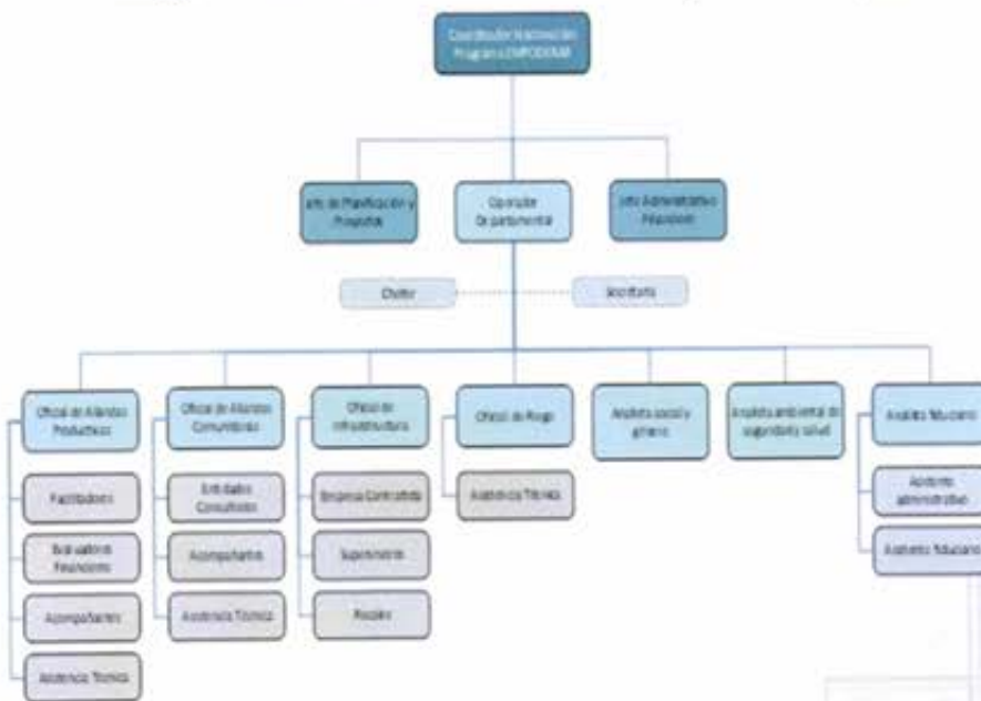
Imagen 2 Estructura funcional Unidad Operativa Departamental